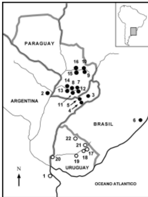
Fig. 1. Localidades de colecta de los ejemplares de Oligoryzomys nigripes incluidos en este estudio. Con círculos abiertos se indican localidades tradicionalmente asignadas a O. delticola . Ver Apéndice 1 por los nombres de las localidades y los especímenes incluidos.

Sin considerar a los haplotipos usados como grupo externo, la longitud de las secuencias luego del alineamiento con las correspondientes inserciones/delecciones fue de 677 pares de bases. A partir de los 49 individuos secuenciados se obtuvieron 33 haplotipos ( Tabla 1 ). Esta elevada diversidad haplotípica no se corresponde con una alta diversidad nucleotídica. El número de sitios variables fue de 61 de los cuales 5 corresponden a inserciones-delecciones. En 8 de las 11 localidades en las que se analizó más de un espécimen se recobró más de un haplotipo. Es así